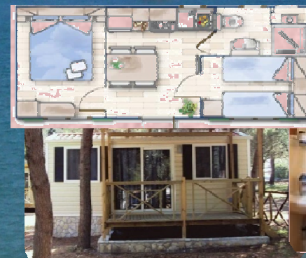
Домик "семья" Shelbox "Giglio"